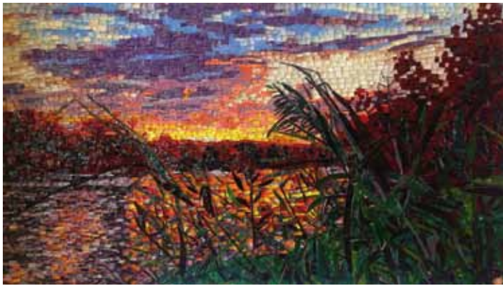
Jour de pêche. Chrystèle Albertini