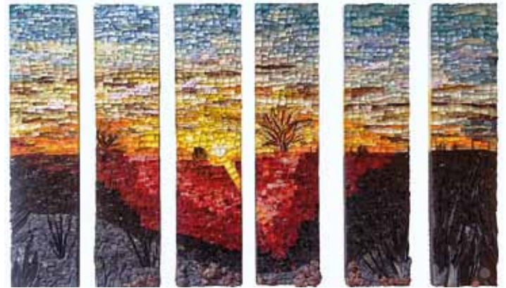
Sur la route. Chrystèle Albertini